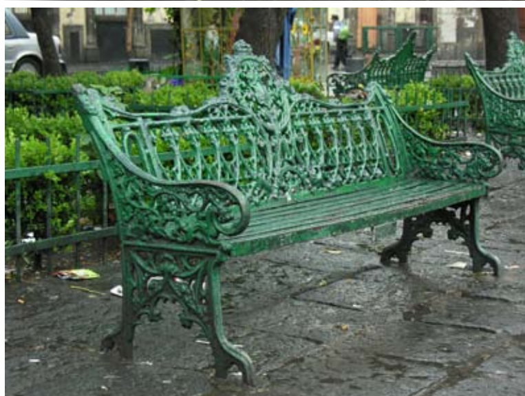
Plaza de Santo Domingo, Ciudad de México.