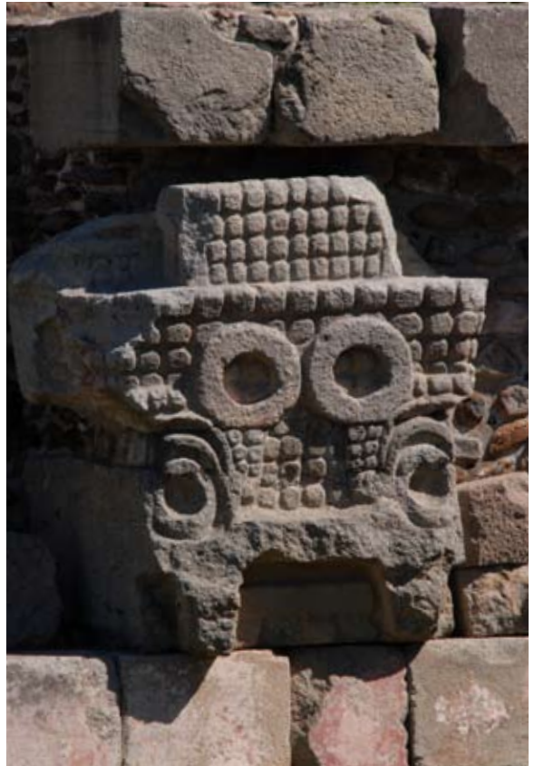
Teotihuacan. Templo de Quetzalcoatl.

investigaciones que están permitiendo conocer de manera más precisa el Imperio Azteca que en sus épocas de esplendor abarcara desde el centro–norte de México hasta parte de Centroamérica. También se visitará el Conjunto Ajaracas, sede de la Autoridad del Centro Histórico, la Casa del Marqués del Apartado, el Museo de la Caricatura y las Criptas de la Catedral Metropolitana, que contienen los restos de los Arzobispos de la Arquidiócesis, desde Fray Juan de Zumárraga hasta el Cardenal de la Ciudad de México.