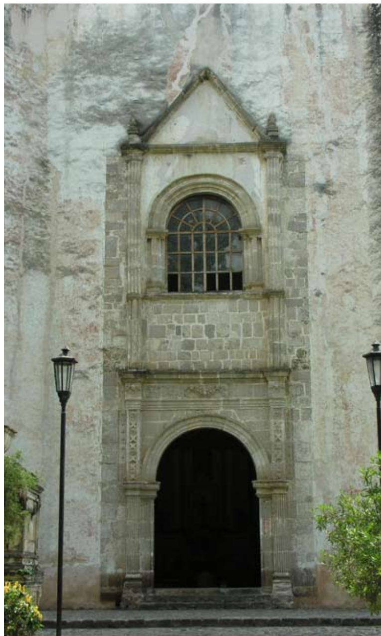
Convento agustino de Tlayacapan en el estado de Morelos.

José María Morelos y Pavón, valiente guerrillero; verdadero ideólogo de la Independencia; autor de los Sentimientos de la Nación ;