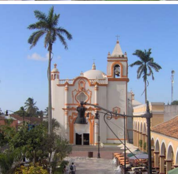
(arriba) Veracruz. (centro y abajo) Tlacotalpan.

ejemplos de selva alta que aún se conserva. Además, su gran biodiversidad y relieve particular, la hacen una región incomparable y llena de belleza. El paseo nos permitirá apreciar la población de Tlacotalpan, el Salto de Eyipantla, en Catemaco, la fábrica de tabacos “Nueva Matacapán”, el Parque Nanciyaga y la zona arqueológica de Tres Zapotes, entre otros atractivos más.