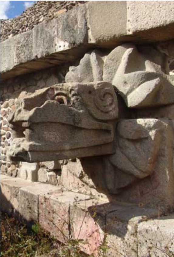
Teotihuacan. Valle de las navajas.