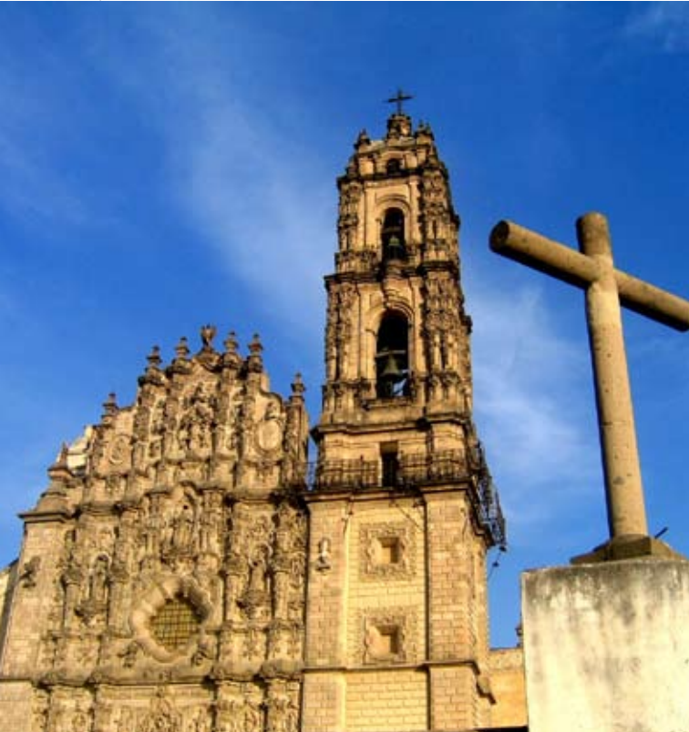
Tepotzotlán.