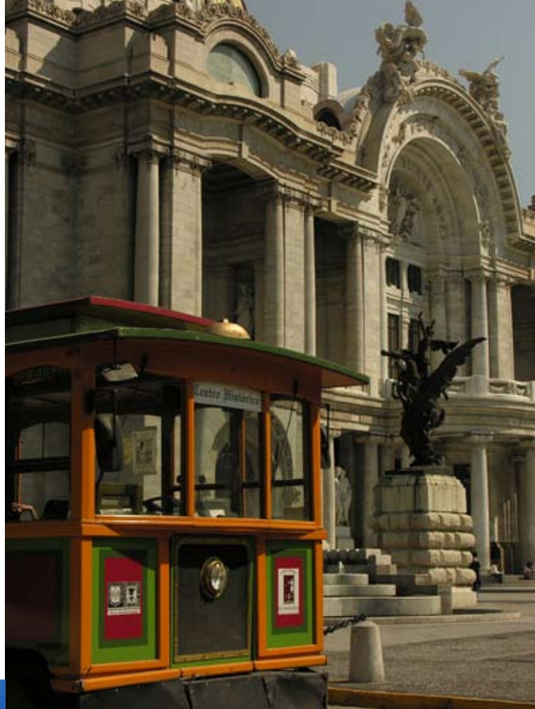
Turibus afuera del Palacio de Bellas Artes.